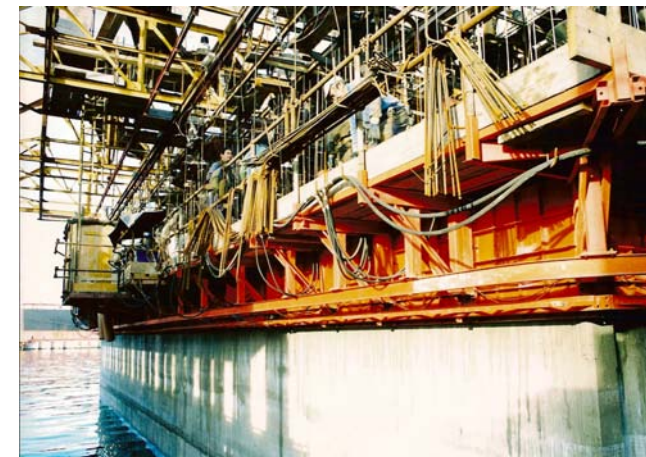
Casseri rampanti per cassoni cellulari in cls