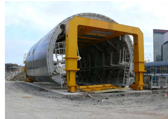
Tronco in getto: 10,00 mt Raggio: 3,80 m