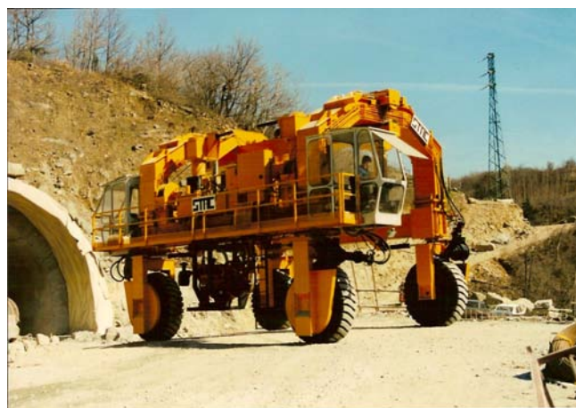
Carrelloni gommati per trasporto manufatti in cemento armato