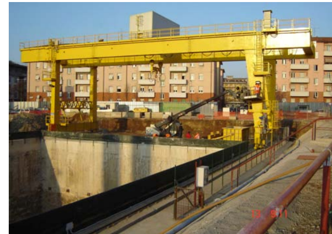
Gru a cavalletto 40 ton metropolitana Brescia