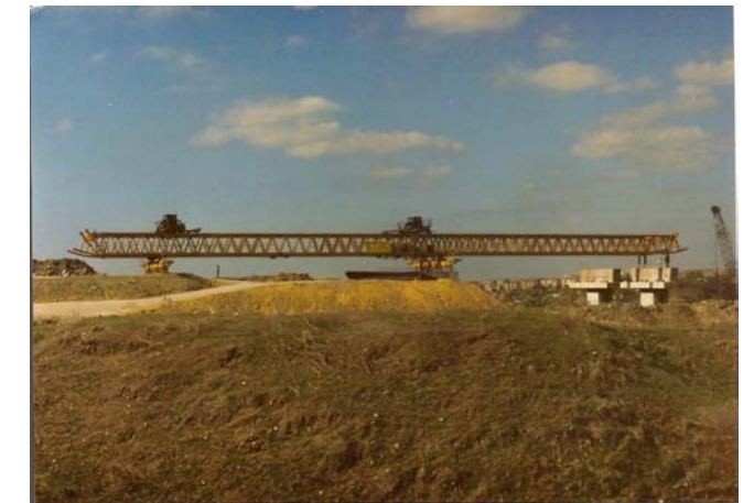
Carro di varo portata 150 ton