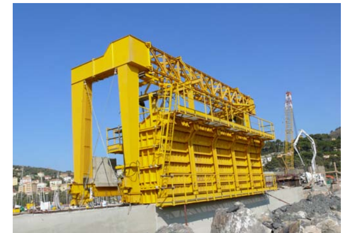
Attrezzatura getto muro paraonde