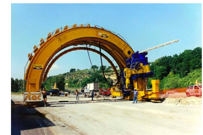
Macchina multifunzione per allargo gallerie in presenza di traffico