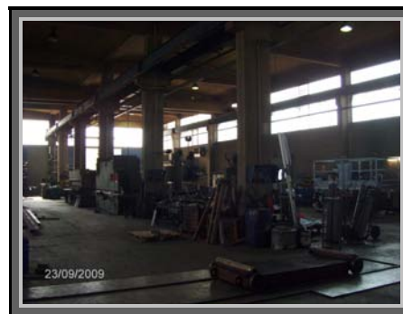
La sede di Mozzate