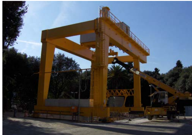
Gru a cavalletto 40 ton Metropolitana di Genova